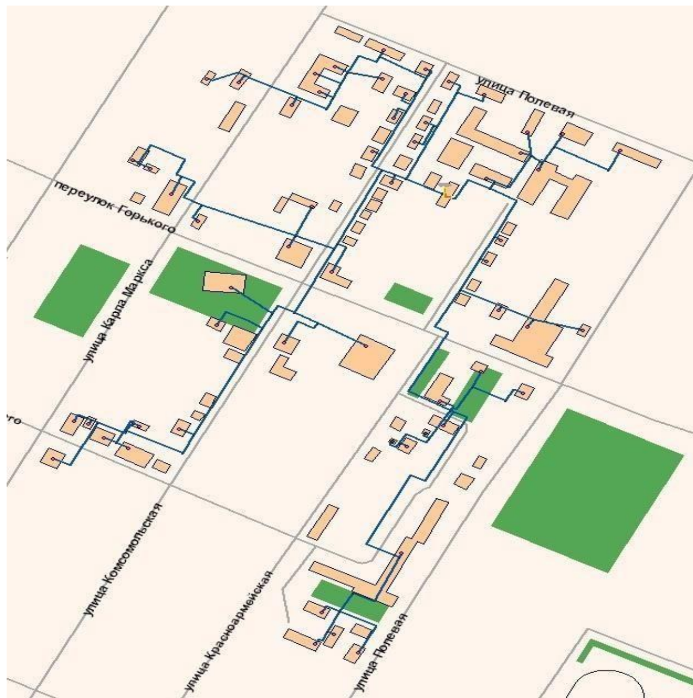
Рисун ок 1.2- Зон а дей ств ия